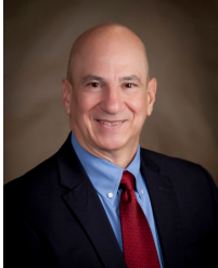
Un mensaje del Director Ejecutivo Peter J. Skandalakis

El sistema judicial puede llevar mucho tiempo y ser confuso para las víctimas de delitos. El Consejo de Abogados Fiscales de Georgia (PAC) es designado por la Oficina del Fiscal General para manejar el procesamiento criminal de casos penales basados en conflictos existentes presentados por el Fiscal de Distrito local o el Fiscal General.